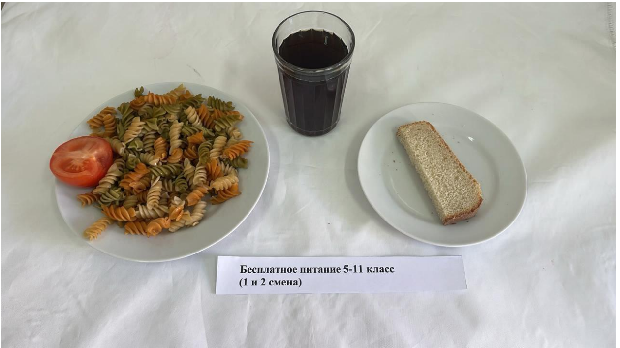
Бесплатное питание 5-11 класс (1 и 2 смена)